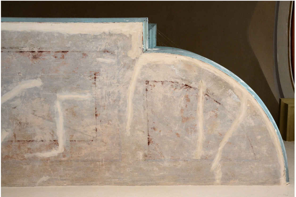
Fot. 5 Frag. spodu chóru w cerkwi prawosławnej pw. Św. Mikołaja Cudotwórcy w Tomaszowie Lubelskim - prawa strona. Stan obecny