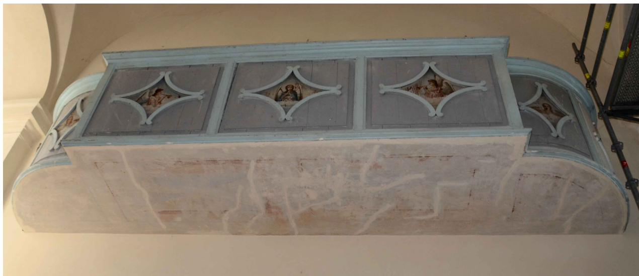
Fot. 1 Dekoracja malarska chóru w cerkwi prawosławnej pw. Św. Mikołaja Cudotwórcy w Tomaszowie Lubelskim. Stan obecny