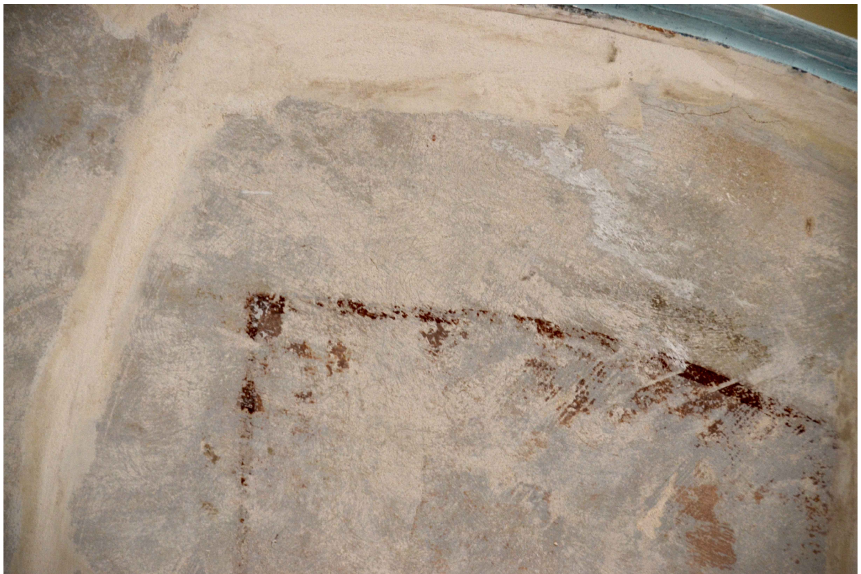
Fot. 6 Frag. spodu chóru w cerkwi prawosławnej pw. Św. Mikołaja Cudotwórcy w Tomaszowie Lubelskim - prawa strona. Stan obecny