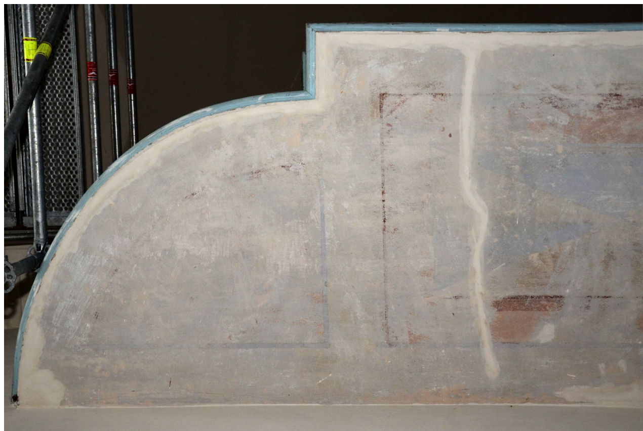
Fot. 2 Frag. spodu chóru w cerkwi prawosławnej pw. Św. Mikołaja Cudotwórcy w Tomaszowie Lubelskim - lewa strona. Stan obecny