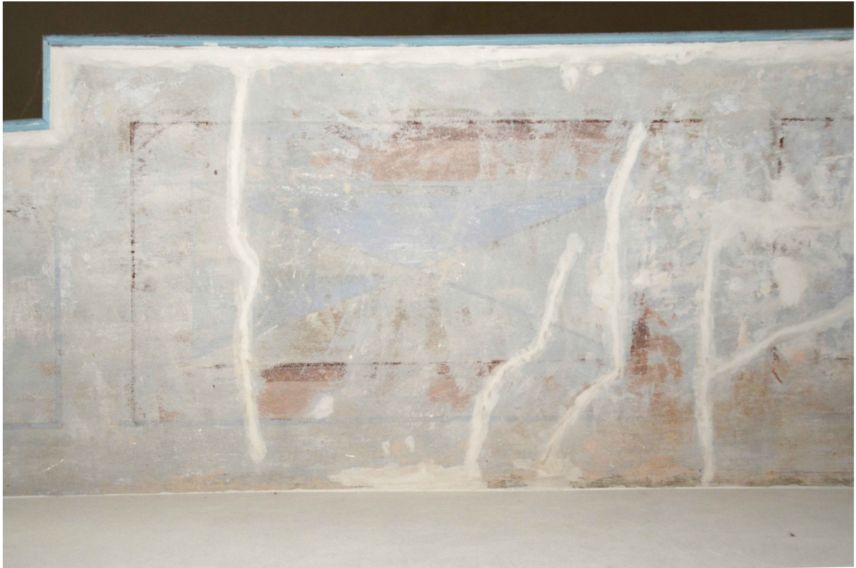
Fot. 3 Frag. spodu chóru w cerkwi prawosławnej pw. Św. Mikołaja Cudotwórcy w Tomaszowie Lubelskim – środkowa część. Stan obecny