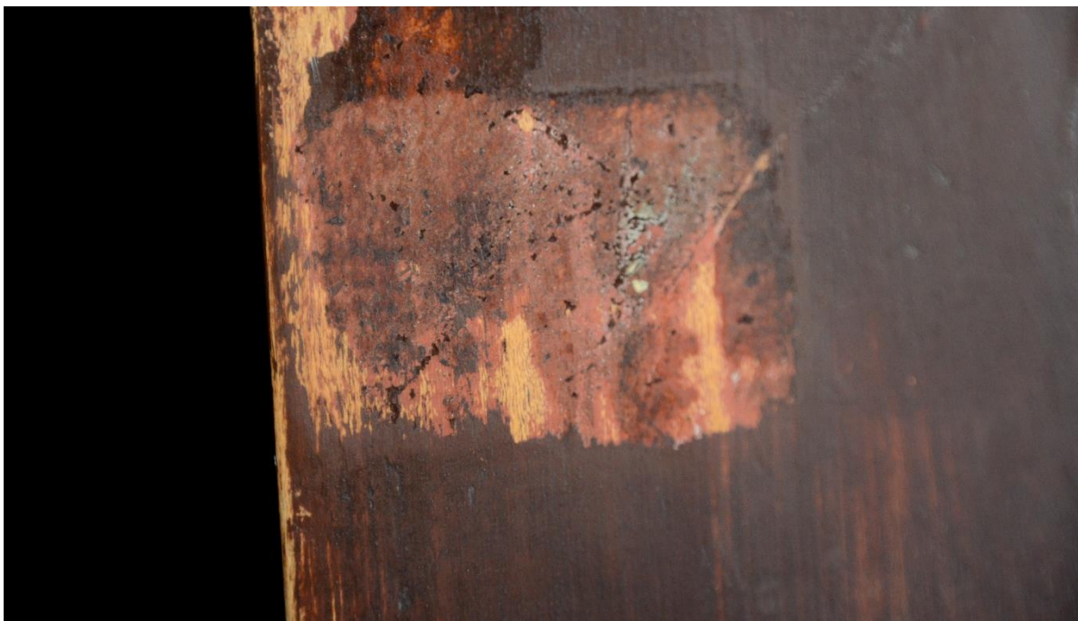
fot. 9. Konfesjonał. Odkrywka ukazująca pierwotną dyspozycję kolorystyczną – marmoryzację w odcieniach czerwieni.