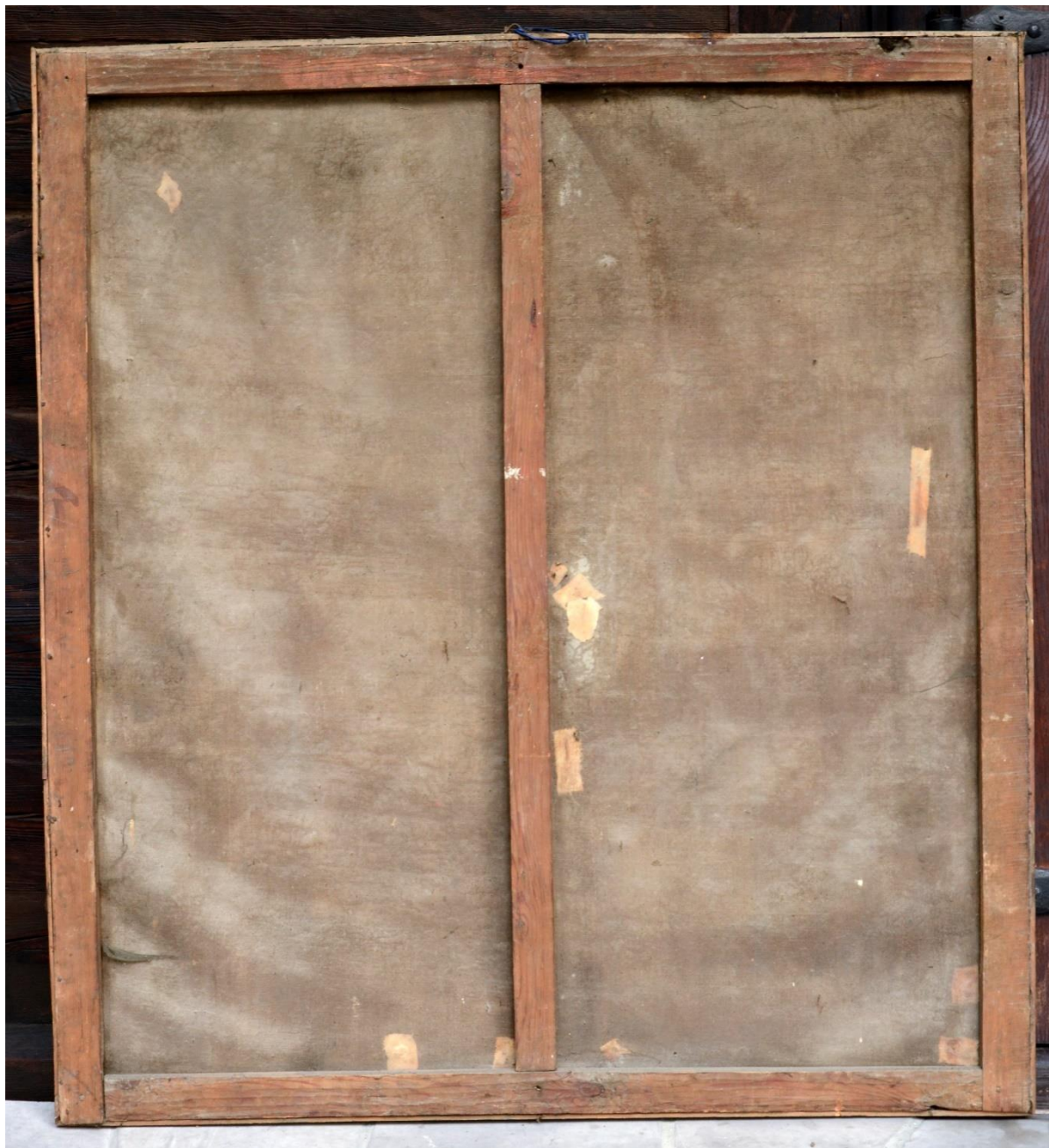
fot. 15. Ustanowienie zakonu Trynitarzy. Widoczne deformacje podobrazia oraz lokalne, niefachowe jego naprawy.