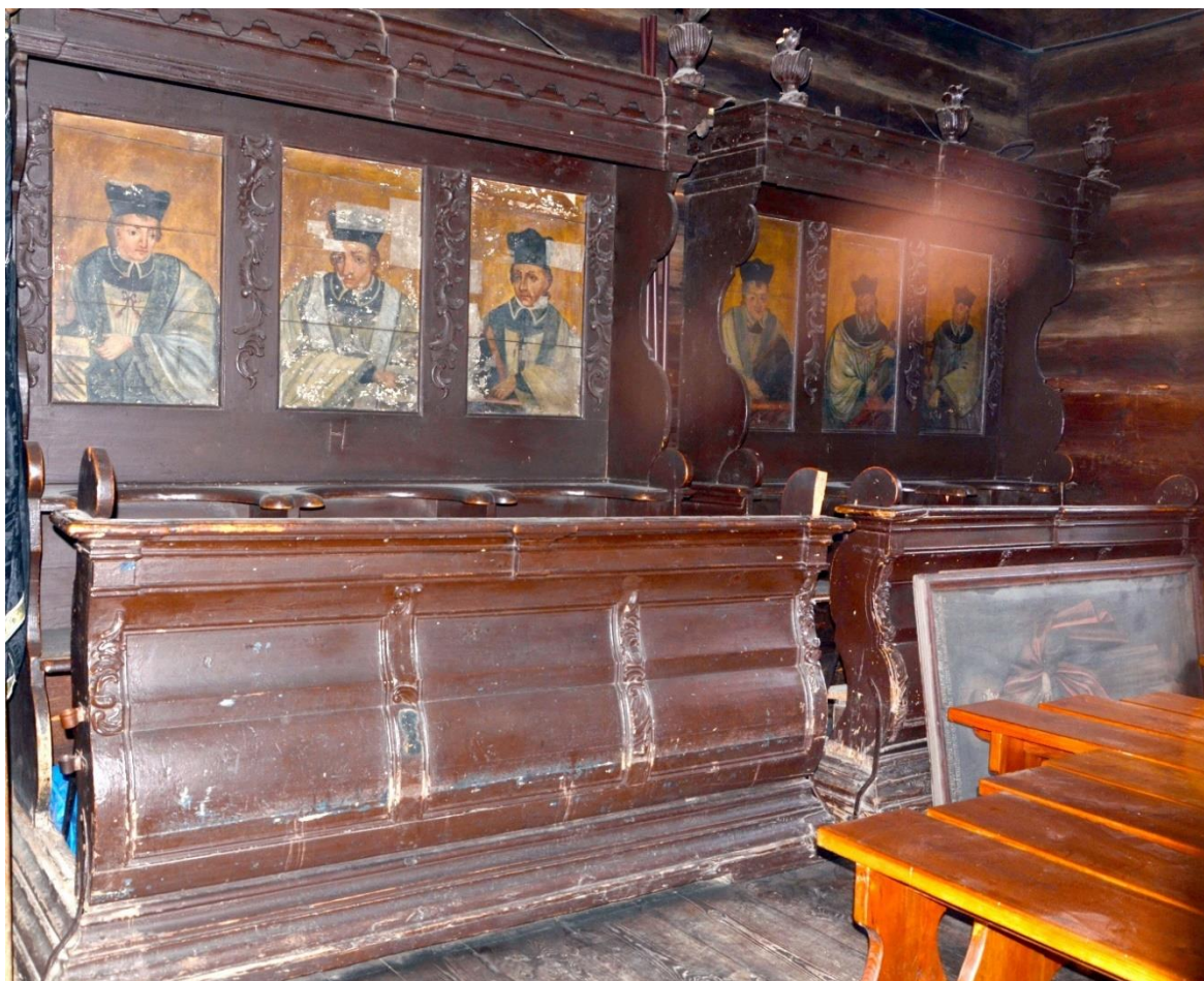
fot. 1. Stalle. Widok ogólny. Widoczne przemalowanie całej powierzchni oraz olbrzymią ilość uszkodzeń i ubytków.