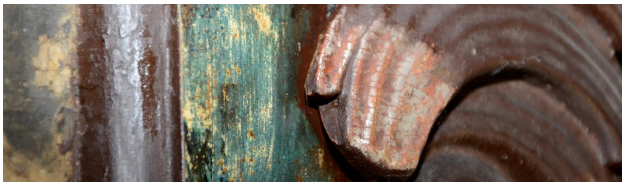
fot. 2. Stalle. Odkrywka ukazująca pierwotną dyspozycję kolorystyczną – marmoryzowaną w odcieniach błękitu strukturę i srebrzone detale ornamentalne.