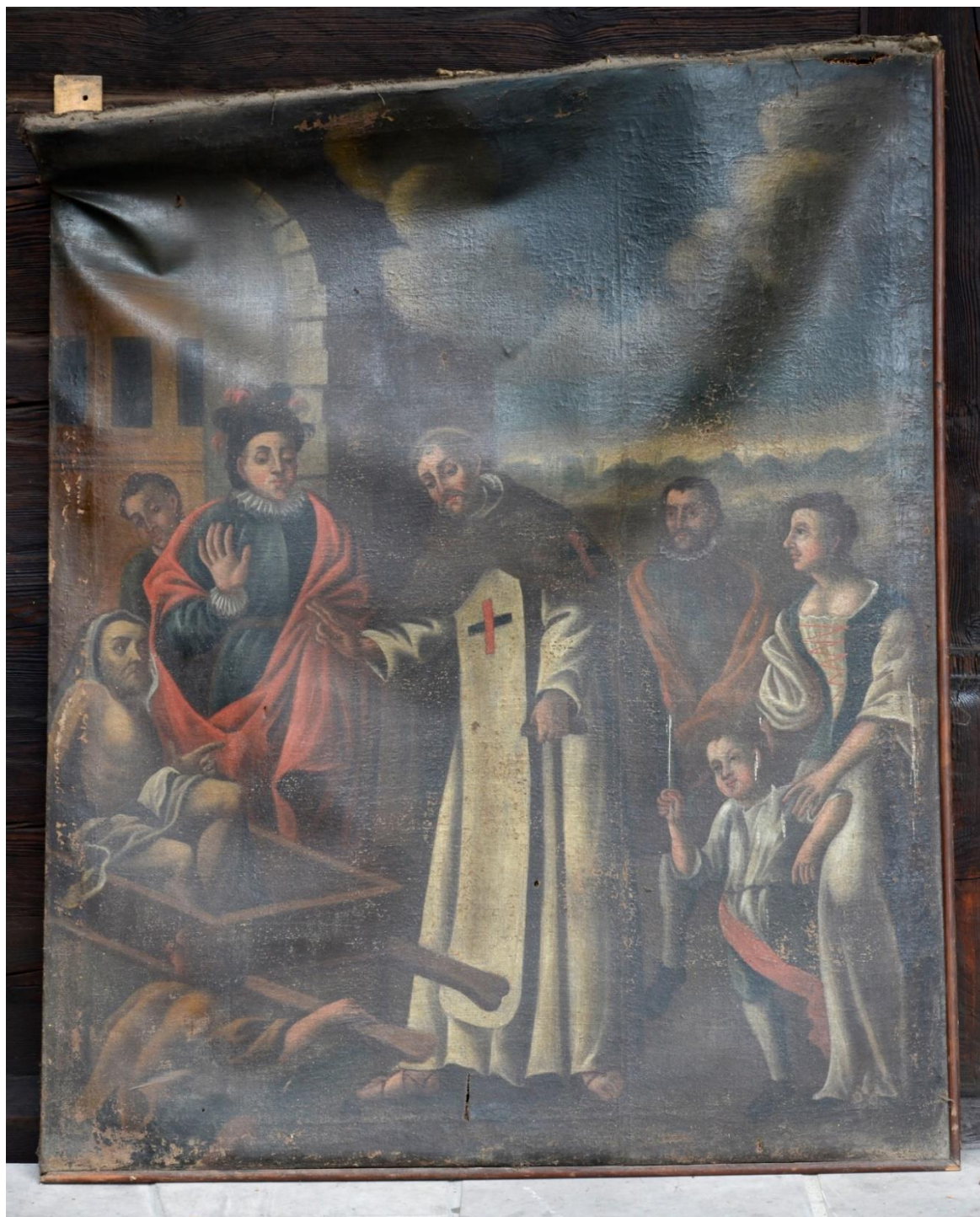
fot. 10. Cud wskrzeszenia zmarłego przez trynitarza. Widoczne bardzo duże, utrwalone deformacje podobrazia spowodowane złamaniem krosien. Powierzchnia pociemniała i pożółknięta, liczne ubytki.