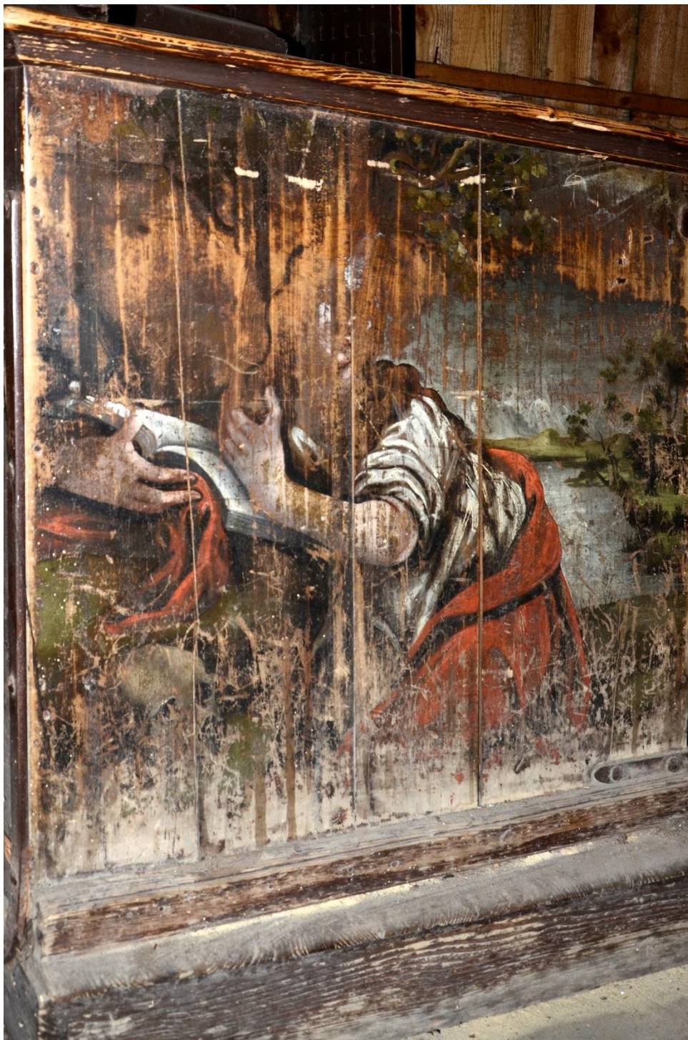
fot. 7. Konfesjonał. Widoczna ogromna skala zniszczeń – przetarte malowidło przedstawiające św. Marię Magdalenę.