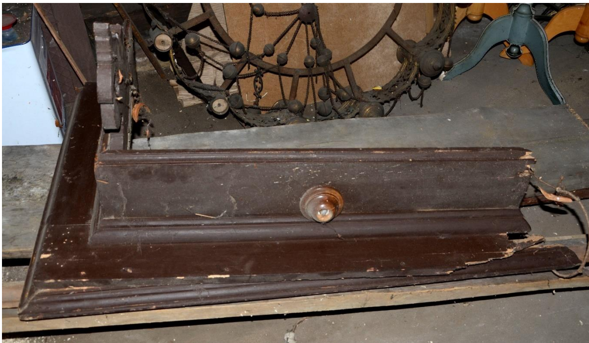
fot. 8. Konfesjonał. Oderwane i połamane elementy baldachimu.