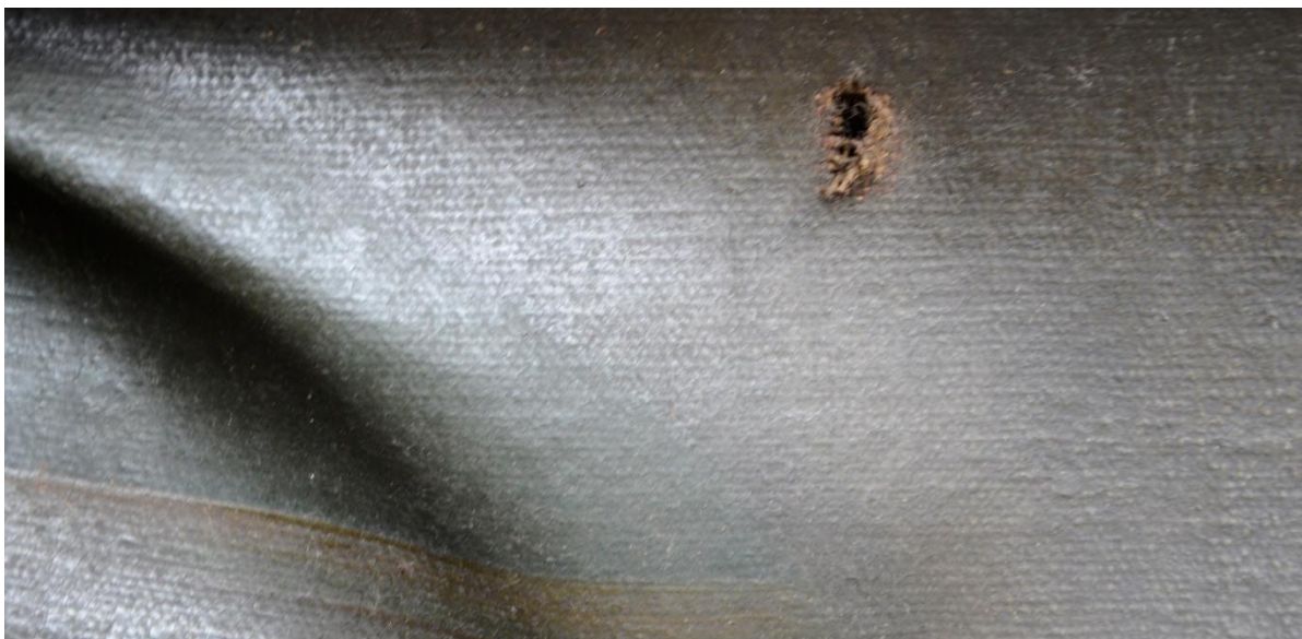
fot. 13 Cud wskrzeszenia zmarłego przez trynitarza. Widoczne bardzo duże, utrwalone deformacje podobrazia spowodowane złamaniem krosien.