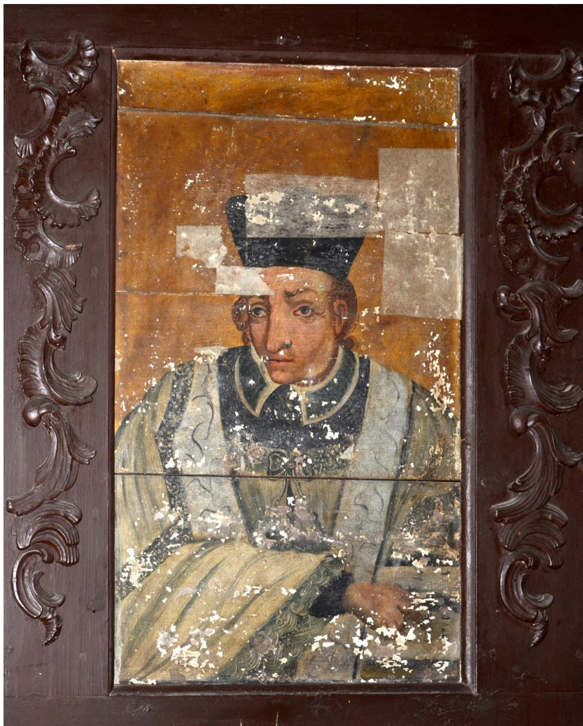
fot. 3. Stalle, portret kanonika. Widoczna duża ilość ubytków warstwy malarskiej oraz zabezpieczenia bibułą japońską. Dekoracje snycerskie, pierwotnie srebrzone, pomalowane na kolor brązowy.