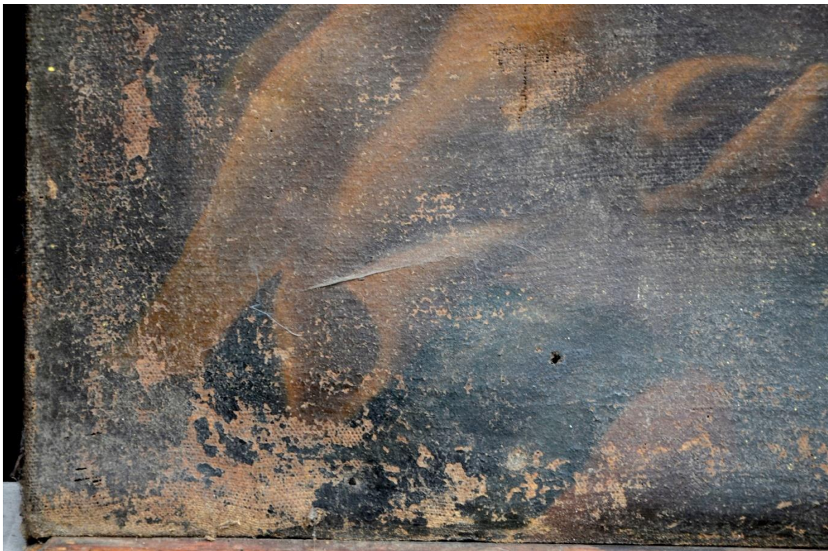
fot. 12. Cud wskrzeszenia zmarłego przez trynitarza. Widoczne ubytki spękanej i odspojonej zaprawy i warstwy malarskiej.