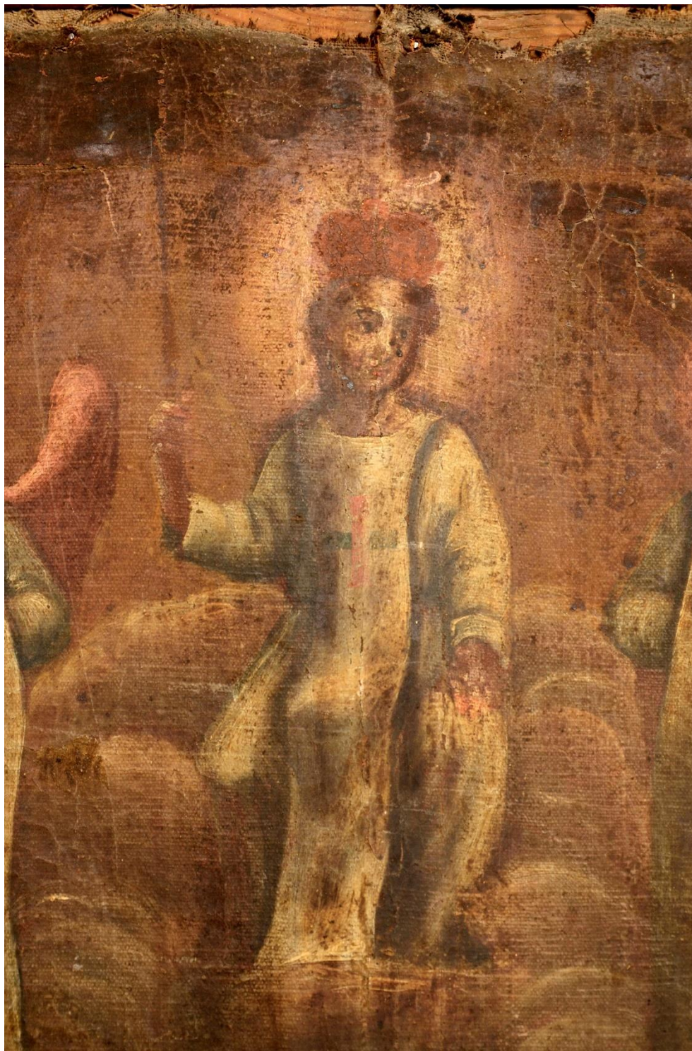
fot. 16. Ustanowienie zakonu Trynitarzy. Widoczne bardzo silne zabrudzenie i pożółknięcie powierzchni.