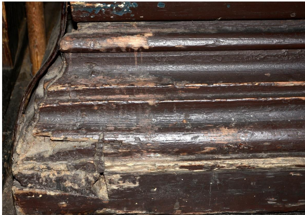
fot. 4. fot. 5. Stalle. Widoczne ubytki warstwy malarskiej obrazu oraz uszkodzenia drewnianych elementów konstrukcji.