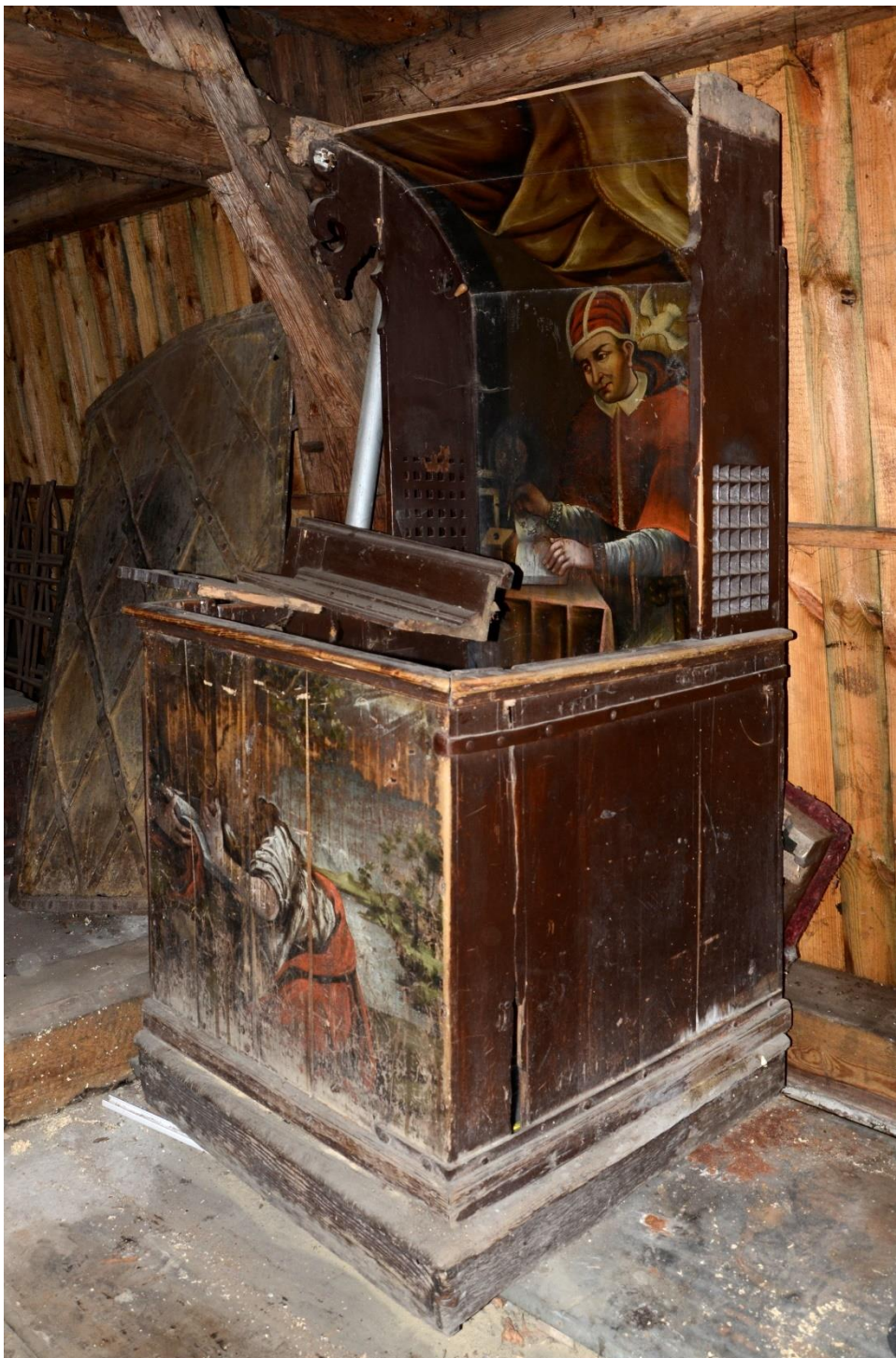
fot. 6. Konfesjonał. Widoczna ogromna skala zniszczeń – przetarte malowidła, zabrudzona i przemalowana konstrukcja, oderwany baldachim.