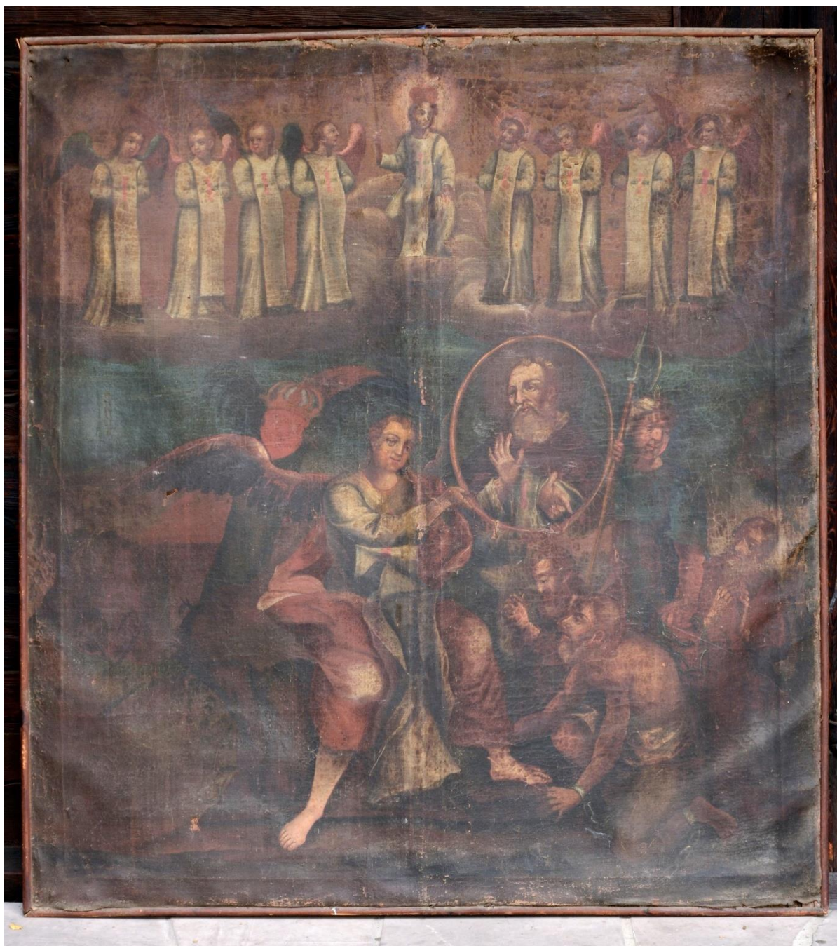
fot. 14. Ustanowienie zakonu Trynitarzy. Widoczne deformacje podobrazia oraz pociemniała, pożółknięta i mocno zabrudzona powierzchnia warstwy malarskiej.