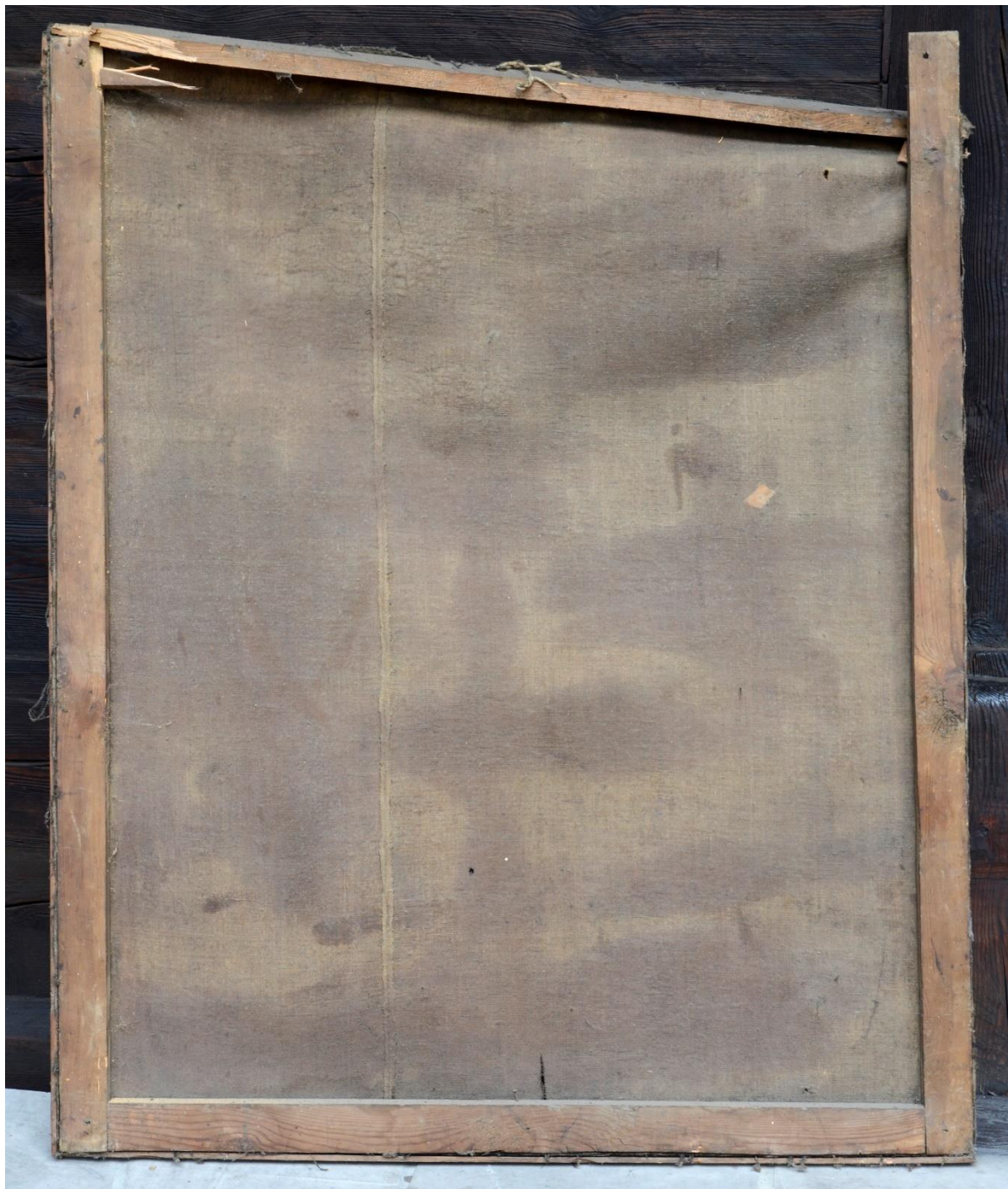
fot. 11. Cud wskrzeszenia zmarłego przez trynitarza. Widoczne bardzo duże, utrwalone deformacje podobrazia spowodowane złamaniem krosien oraz łączenie brytów płótna.