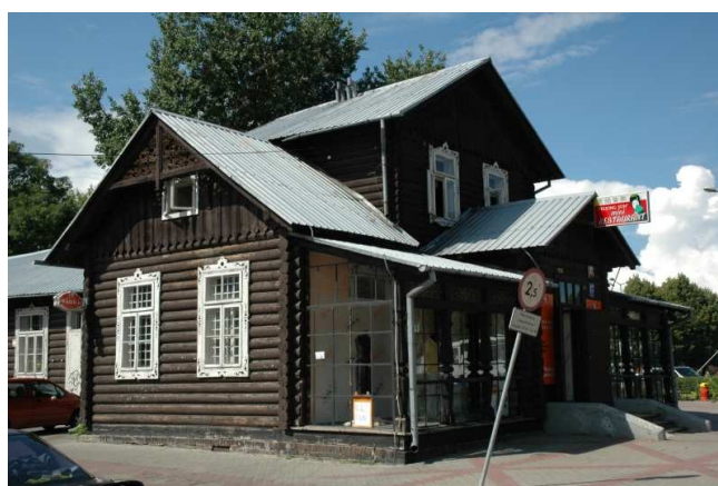
„Herbaciarnia”- dom drewniany z 1985 roku.

Uwagę również przykuwa „Herbaciarnia”, dom drewniany z 1895 roku.