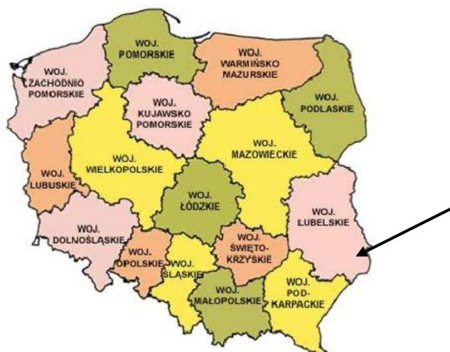
Województwo lubelskie na tle kraju

Województwo lubelskie obejmuje obszar położony w międzyrzeczu Wisły i Bugu. Rzeki te są naturalnymi granicami od strony zachodniej i na przeważającym odcinku części wschodniej. Województwo znajduje się w środkowo-wschodniej Polsce, przy granicy państwowej od wschodu z Białorusią i Ukrainą, w sąsiedztwie woj. podkarpackiego, świętokrzyskiego, mazowieckiego i podlaskiego.