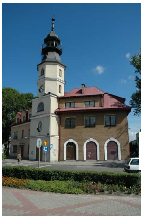
Państwowa Szkoła Muzyczna -dawniej Straż Pożarna

W narożniku północno-wschodnim Miasta Tomaszowa Lubelskiego uwagę zwraca wieża budynku straży pożarnej. Po przebudowie obiekt ten służy Państwowej Szkole Muzycznej.