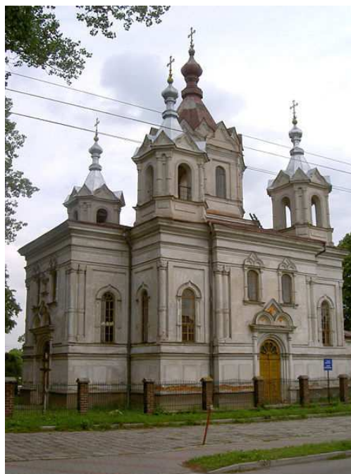
Cerkiew prawosławna pw. św. Mikołaja z 1889 roku.

Pośród najważniejszych zabytków Tomaszowa Lubelskiego wymienić należy także Muzeum Regionalne im. Janusza Petera, cmentarz żydowski, Rezerwat Przyrody „Piekiełko”. Turystyczną atrakcją jest grobowiec rodziny Bujalskich i Bohlerów z przełomu XIX/XX wieku, umiejscowiony na cmentarzu parafialnym. Ponadto budynek Wydziału Powiatowego Sejmiku Tomaszowskiego z 1925 roku, obecnie budynek administracyjny Urzędu Miasta, Dom Związku Ziemiaków, budynek z 1930 roku, obecnie sąd rejonowy.