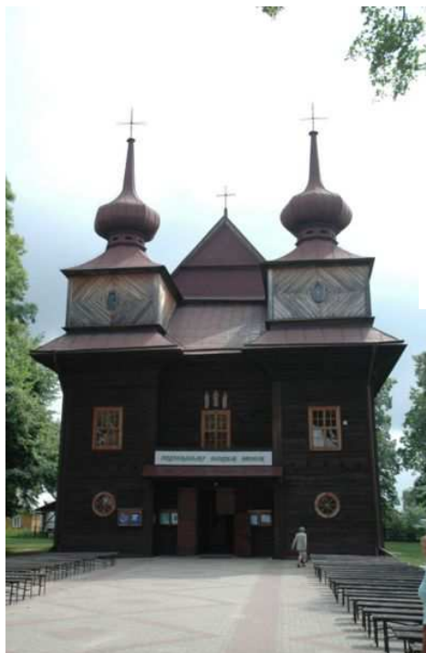
Drewniany Kościół pw. Zwiastowania NMP z 1627 roku.

Obok opisanego sanktuarium znajduje się drewniana dzwonnica wzniesiona w wieku XVIII. Na uwagę zasługuje również Kościół pw. Najświętszego Serca Pana Jezusa wzniesiony w latach 1935-49. Ta murowana świątynia posiada wiele elementów zabytkowego wyposażenia. Do najcenniejszych należą: ołtarz boczny z obrazem Matki Boskiej z Dzieciątkiem, barokowe obrazy św. Anny Samotrzeciej i Wniebowzięcia Matki Boskiej, ambona św. Piotra w kształcie łodzi z rzeźbami dwóch apostołów oraz późnobarokowy krucyfiks znajdujący się w jednym z bocznych ołtarzy.