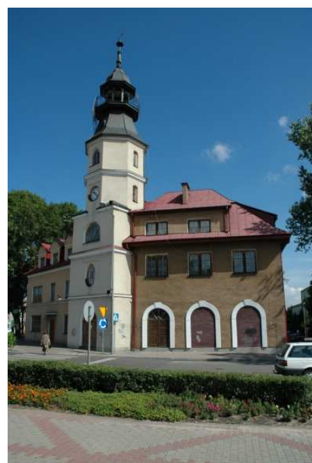
Szkola Muzyczna