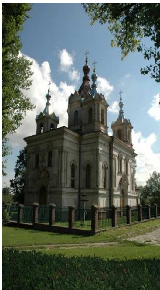
Cerkiew prawosławna pw. Św. Mikołaja Cudotwórcy