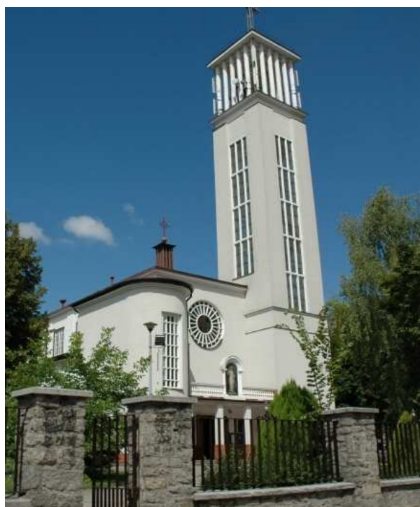
Kościół pw. Najświętszego Serca Pana Jezusa