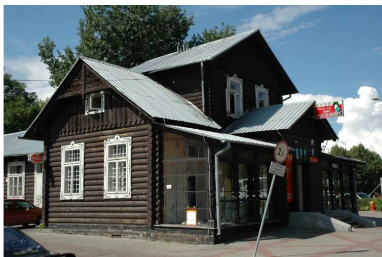
Dawna herbaciarnia „Czajnia”