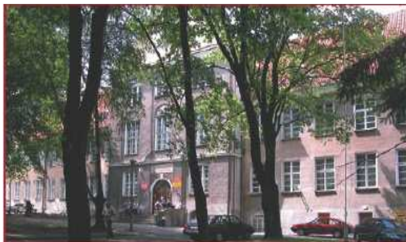
Zespół Szkół nr 1 w Tomaszowie Lubelskim