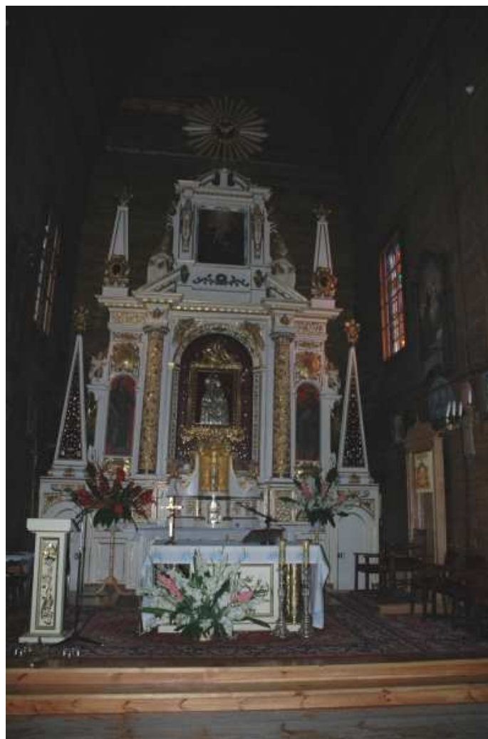
Ołtarz główny kościoła pw. Zwiastowania NMP

Murowana cerkiew prawosławna pw. św. Mikołaja Cudotwórcy z 1890 roku, zlokalizowana we wschodniej pierzei rynku została wzniesiona przez władze rosyjskie. To budowla trójdzielna, z kopułą nad nawą i czterema wieżyczkami, imitującymi kopułki z kokosznikami wokół hełmów. Wewnątrz odnajdziemy malowidła naścienne z pierwszej połowy XX w. Z tego też okresu pochodzi ikonostas. Najcenniejsza ikona Matki Boskiej z Dzieciątkiem datowana jest na wiek XVII.