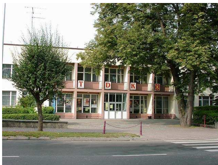
Tomaszowski Dom Kultury

W mieście funkcjonują dwie szkoły podstawowe, dwa gimnazja, cztery szkoły ponadgimnazjalne, policealne studium medyczne i szkoła specjalna. Tomaszów jest miastem uniwersyteckim. Tu ma swoją siedzibę Wydział Zamiejscowy Katolickiego Uniwersytetu Lubelskiego kształcącej młodzież z całej Polski i z zagranicy oraz Kolegium Języków Obcych.